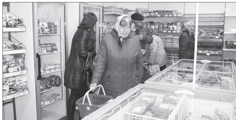
В павильоне «Ника», д. Уза

На улице Советской в Буда-Кошелево в январе открылся