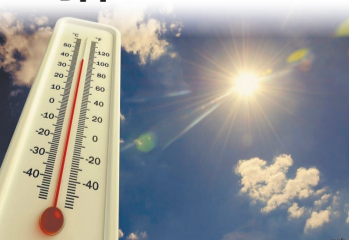
По информации интернет-ресурсов

Сегодня в течение суток ожидается пасмурная погода, небольшой дождь; ночью +4..6°, днем +7..9°, ветер юго-восточный, умеренный. Восход солнца – 8.08, заход – 17.14, долгота дня – 9.06. Фаза луны – вторая четверть.