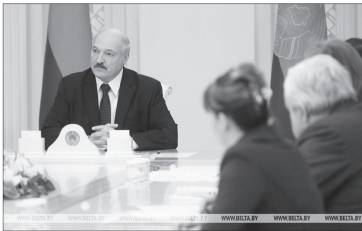
Александр Лукашенко во время совещания

Глава государства привел данные сравнительной статистики за прошлый и этот годы по количеству смертельных случаев в результате пневмонии. По его словам, в 2019 году за январь-февраль таких случаев было 196, сейчас 138. Всего из-за заболеваний органов дыхания за первые два месяца прошлого года погибли 498 человек, в начале этого