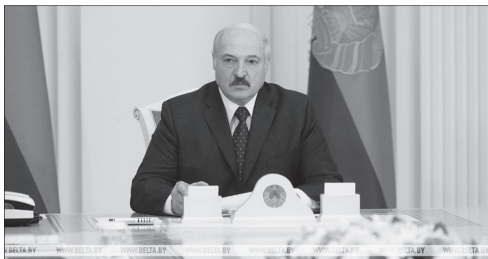
Александр Лукашенко во время совещания

Главная задача государственных органов системы обеспечения национальной безопасности – сохранить стабильность в стране, обеспечить законность и правопорядок. На это обратил внимание Президент Беларуси Александр Лукашенко 9 июня во время совещания по вопросам деятельности государственных органов системы обеспечения национальной безопасности