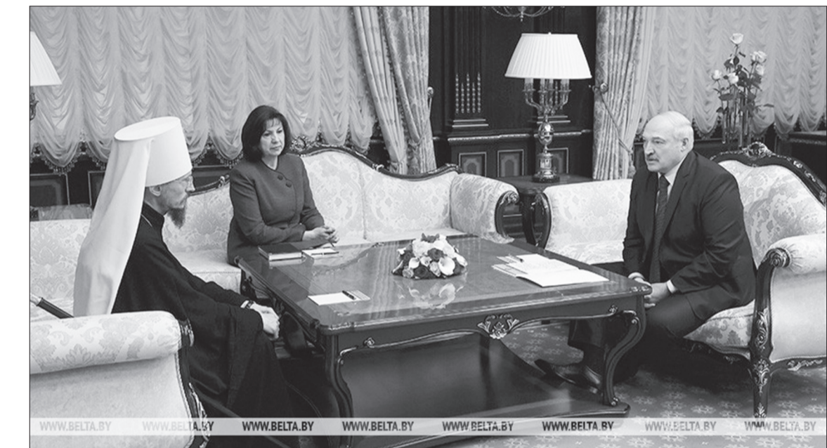
Александр Лукашенко во время встречи

темы пандемии. Он отметил, что последствия распространения коронавирусной инфекции серьезно повлияли на экономику как государства, так и церкви. «Приходы немного обеднели, потому что меньше людей приходит, хотя мы храмы никогда не закрывали и закрывать не будем,