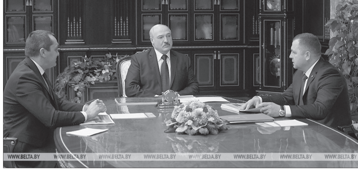
Александр Субботин, Александр Лукашенко и Виталий Дрожжа

Глава государства обратил внимание, что Беларусь – одно из ведущих государств Европы с точки зрения лесных ресурсов. Корневой запас дре-