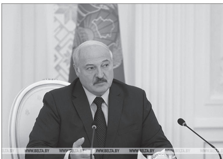
Александр Лукашенко во время совещания

Глава государства отметил, что тема санкций продолжа-