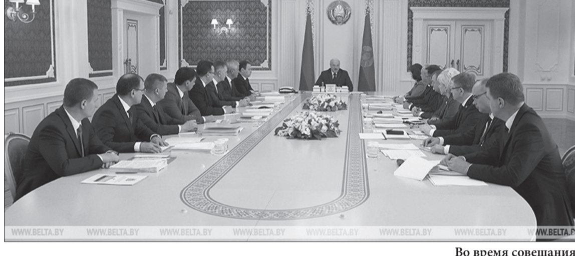
Во время совещания

Кроме того, Президент напомнил о своем требовании разобраться с выплатами зарплат