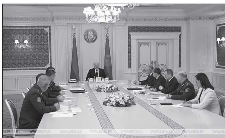
Во время совещания

Александр Лукашенко подчеркнул, что в этой ситуации поражает реакция польских политиков и чиновников Европейского союза: «Вместо поиска совместных с белорусской стороной решений Евросоюз сворачивает проекты трансграничного сотрудничества и взаимодействия. Кроме того, угрожают новыми пакетами санкций и строитель-