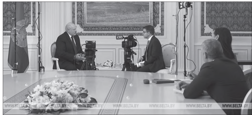
Во время интервью

Практически половина интервью была посвящена происходящему сегодня в Украине. «Вы его создали, этот кризис. Это рукотворный, вами созданный кризис. Вы породили эту войну», – заявил Александр Лукашенко. Отвечая на вопрос французского журналиста о роли Беларуси в происходящих в Украине событиях, Александр Лукашенко обратил внимание, что в Беларуси состоялось несколько «весьма успешных» раундов переговоров между Россией и Украиной. Но Запад – прежде всего США и Великобритания – запретили Украине продолжать их. Глава государства напомнил, что в 2015 году после длительных переговоров «нормандской четверки» в белорусской столице были подписаны Минские соглашения: «И если бы этот