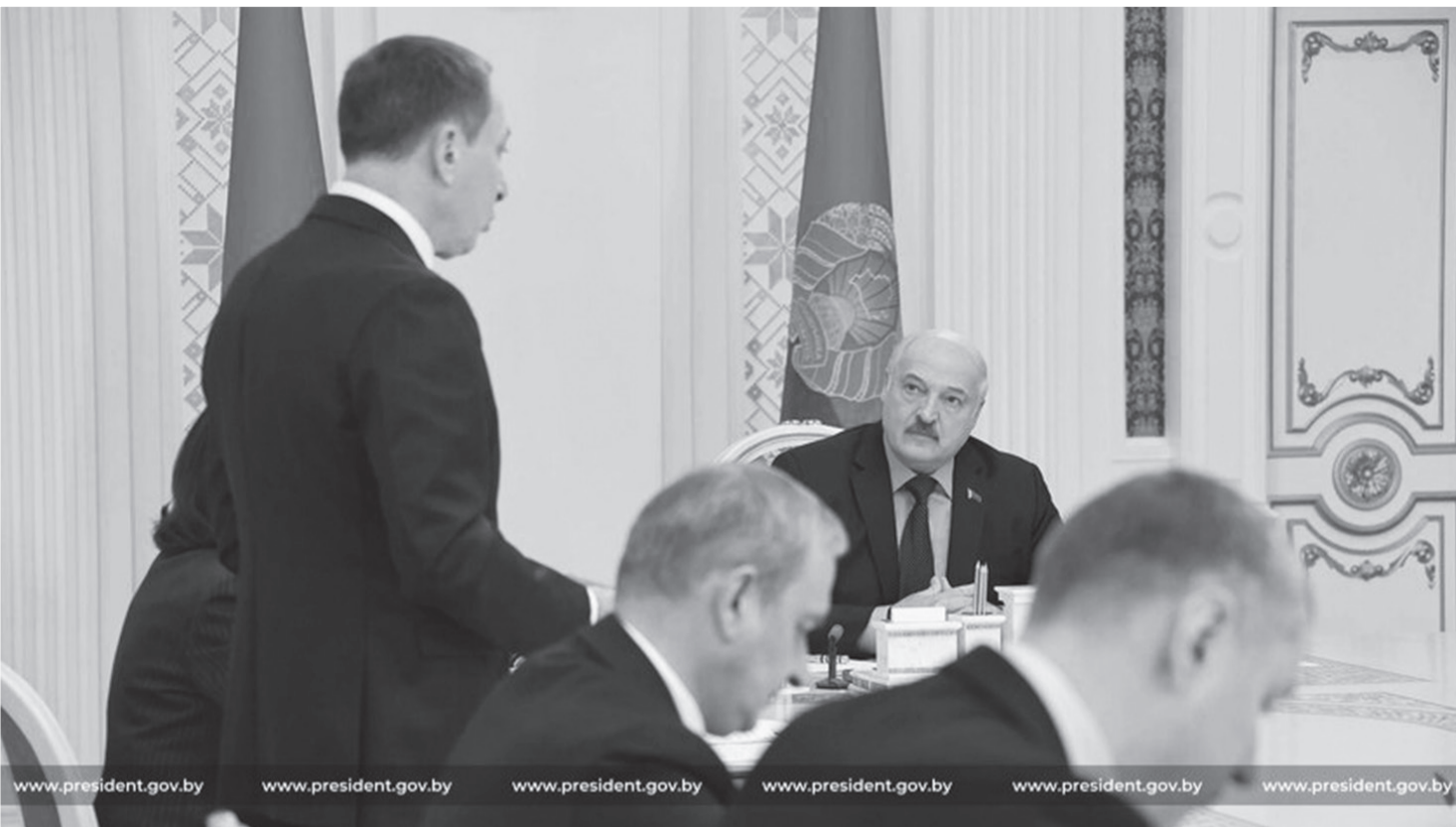
Во время совещания