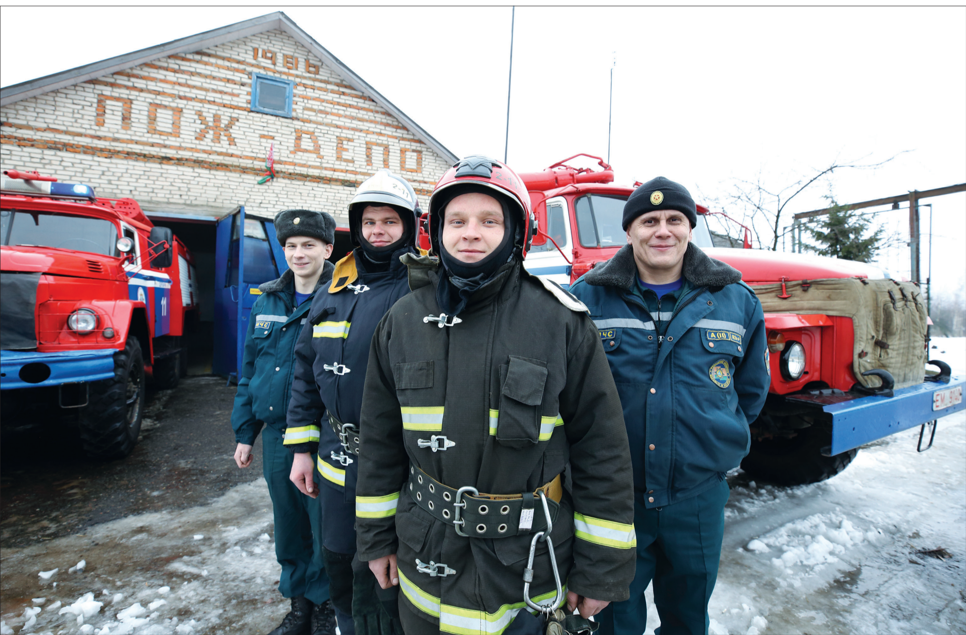
Дербичские спасатели всегда готовы выехать на вызов

СУБОТА | 21 СТУДЗЕНЯ 2023 | №3 (9184) | Буда-Кашалёўская раённая газета | Выдаецца з 1 кастрычніка 1931 года