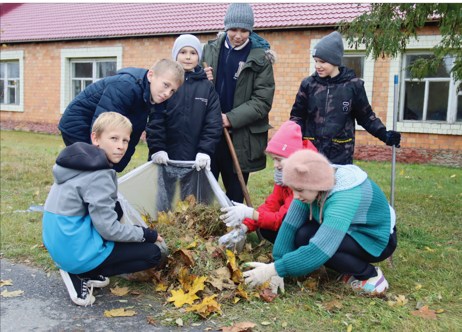
Гимназисты райцентра наводят порядок по улице Ленина

СУБОТА | 28 КАСТРЫЧНИКА 2023 | №43 (9224) | Буда-Кашалёўская раённая газета | Выдаецца з 1 кастрычніка 1931 года